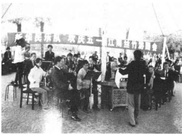
▲ 2005年民乐队参加大华行知公园的庆“五一”游园会活动

学编辑，还担着个“作家”名头。直到今天我才蓦然想明白，原来这都是有着历史渊源的呀！一笑。